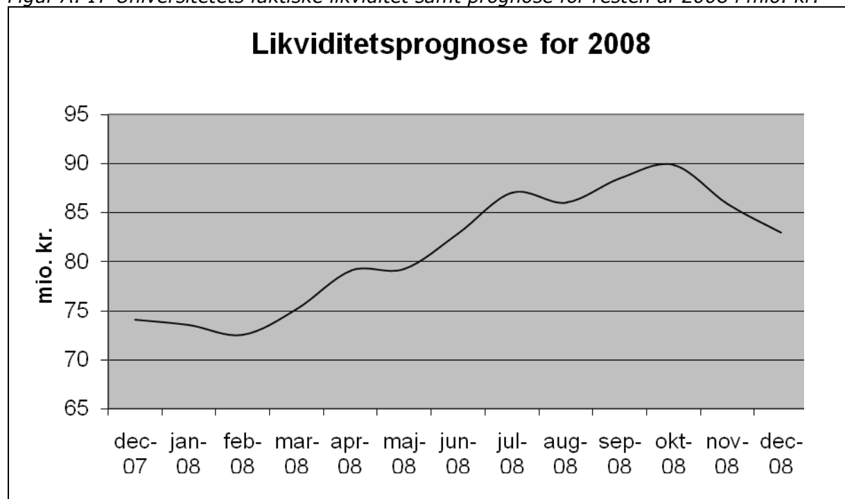
Figur A: IT-Universitetets faktiske likviditet samt prognose for resten af 2008 i mio. kr.

Renteindtægterne forventes at være i niveau 3 mio. kr. i 2008. Renteindtægterne indgår i posten Andre indtægter , jf. bilag 11A.